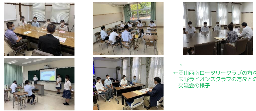
↑岡山西南ロータリークラブの方々や、玉野ライオンズクラブの方々との交流会の様子

岡山西南ロータリークラブ、玉野ライオンズクラブの方々にご協力いただき、採用試験の面接において印象が悪くなるかもしれない服装頭髪や、男女の性差についてなど、色々なお話を聞かせていただきました。